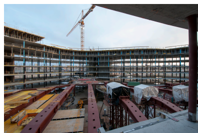
© Gmeiner Haferl Zivilingenieure ZT GmbH