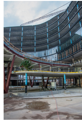
© Gmeiner Haferl Zivilingenieure ZT GmbH