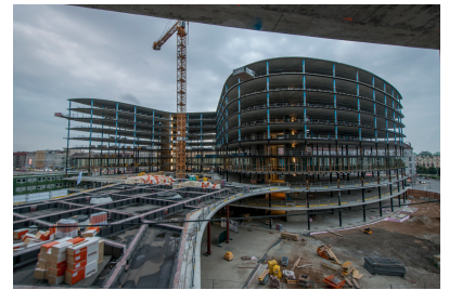
© Gmeiner Haferl Zivilingenieure ZT GmbH