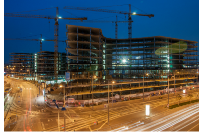
© Gmeiner Haferl Zivilingenieure ZT GmbH