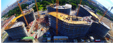
© gmeiner haferl zivilingenieure zt gmbh