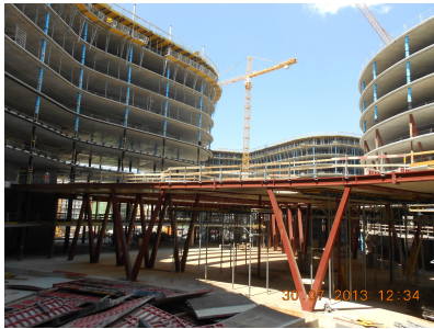
© Gmeiner Haferl Zivilingenieure ZT GmbH