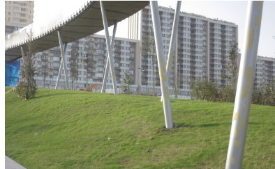
© Hoffmann – Janz Ziviltechniker GmbH