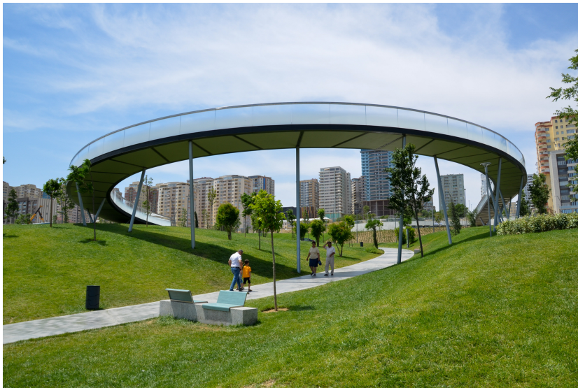
© Hoffmann – Janz Ziviltechniker GmbH