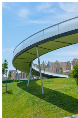
© Hoffmann – Janz Ziviltechniker GmbH