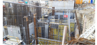
© gmeiner haferl zivilingenieure zt gmbh