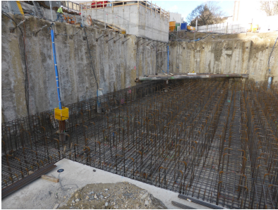
© gmeiner haferl zivilingenieure zt gmbh