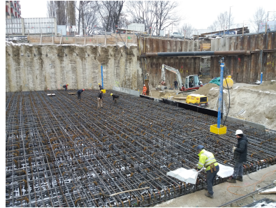
© gmeiner haferl zivilingenieure zt gmbh