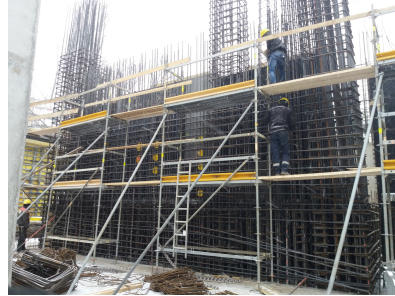
© gmeiner haferl zivilingenieure zt gmbh