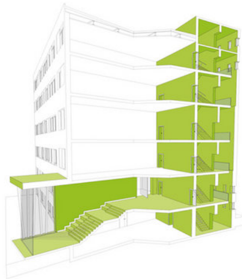
UBS_Wettbewerb Mittelstandszentrum Triumph Adler Nürnberg_Schnittperspektive Kern