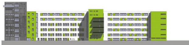
UBS_Wettbewerb Mittelstandszentrum Triumph Adler Nürnberg_Ansichten