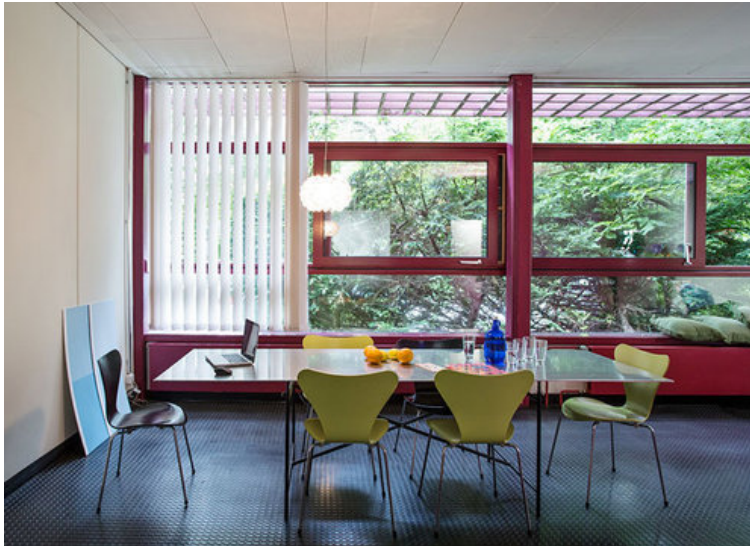
Leben und Arbeiten im Loft