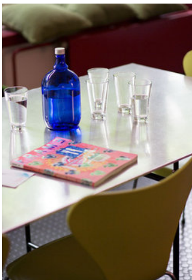
Leben und Arbeiten im Loft_Tisch